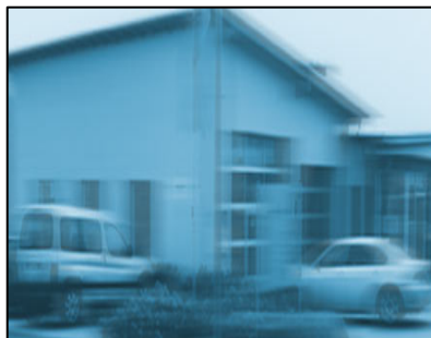
Büroansicht, Bad Camberg