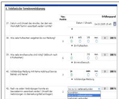
Auszug aus einem InfoPath Fragebogen